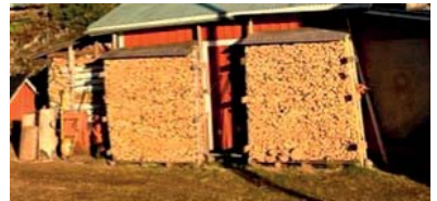
Halkopino. Kiitos puutalkoolaisille!