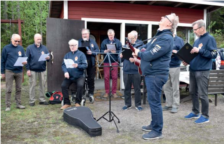
Hyvinkään Työvään Mieskuoro laulaa

Avajaispäivä eteni nauttien alkukesästä, saunasta, grillimakkarasta ja muutamat rohkeat myös raikkaasta Usminjärven vedestä.